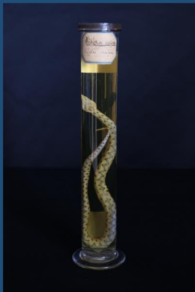
Vipère aspic, Vipera aspis L., spécimen naturalisé conservé en fluide (formol), XIX e siècle, Montpellier, collection de zoologie de l'université de Montpellier, inv. UM.RA.1503