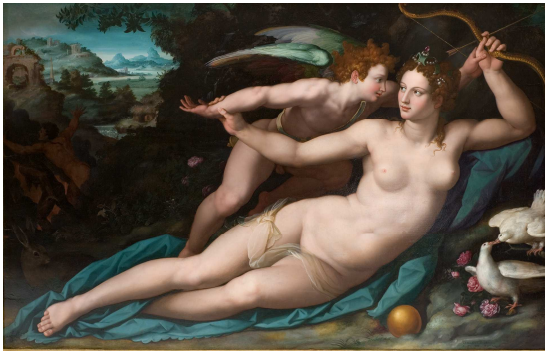
Vénus et l'amour, Allori, 1570