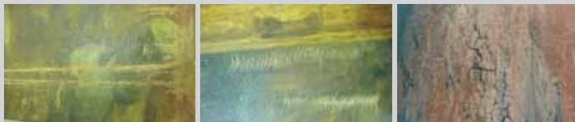
Perte de matière le long de la pliure