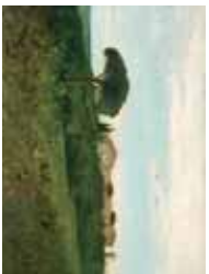
Lunel-Viel Vue de la Tour de Farges (1854), Musée Fabre, Montpellier.