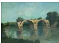
Le Pont d'Ambrussum, 1854, © Musée Fabre-Montpellier Agglomération cliché Frédéric Jaulmes