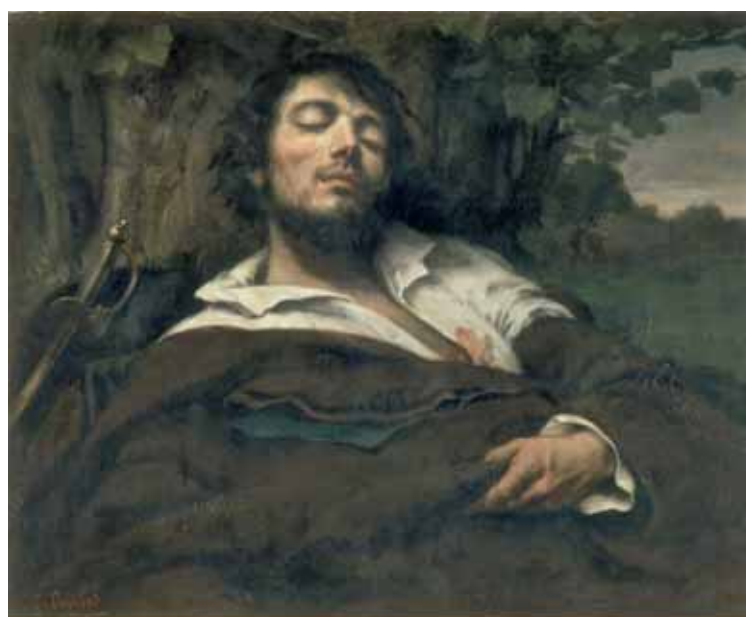
Portrait de l'artiste dit L'homme blessé 1844-1854

Huile sur toile, 0,81x0,97 m Musée d'Orsay à Paris, RF 338