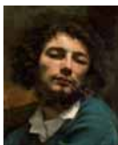
L'Homme à la pipe, vers 1849, © Musée Fabre-Montpellier Agglomération Cliché Frédéric Jaulmes