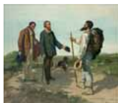
La Rencontre, 1854, © Musée Fabre- Montpellier Agglomération cliché Frédéric Jaulmes