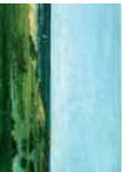
Souvenir des cabanes (1854), Philadelphia Museum of Art