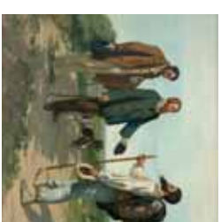
Mireval, Vic-la-Gardirole La Rencontre ou Bonjour Monsieur Courbet (1854), Musée Fabre, Montpellier