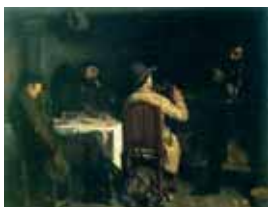
Une après-dînée à Ornans, 1848-1849