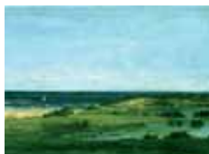
Souvenirs des Cabanes, Philadelphie, Museum of Art, © John G. Johnson Collection, 1917/ Photo Joseph Mikuliak