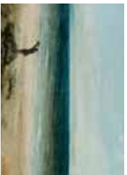
Villeneuve-les-Maguelone, Le Bord de la mer à Palavas (1854), Musée Fabre, Montpellier.