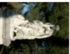
Montpellier Hécate et Cerbère, Parc de Grammont Adèle Castiglione-Colonna, (1836-1879) dit Marcello