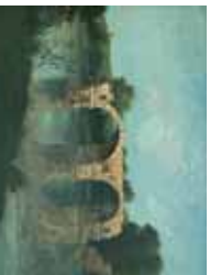
Villetelle Pont d'Ambrussum (1854), Musée Fabre, Montpellier.