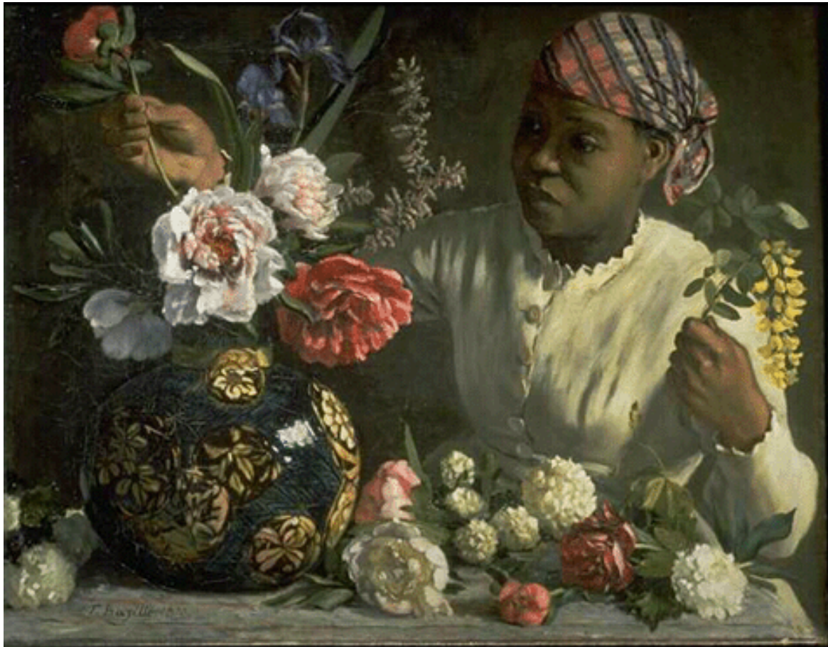
Tablèu n°5 : « La négresse aux pivoines », Frédéric BAZILLE, (Montpellier, 1841 - Beaune la Rolande, 1870), òli sus fusta, Musèu Fabre, Montpelhièr, Erau.