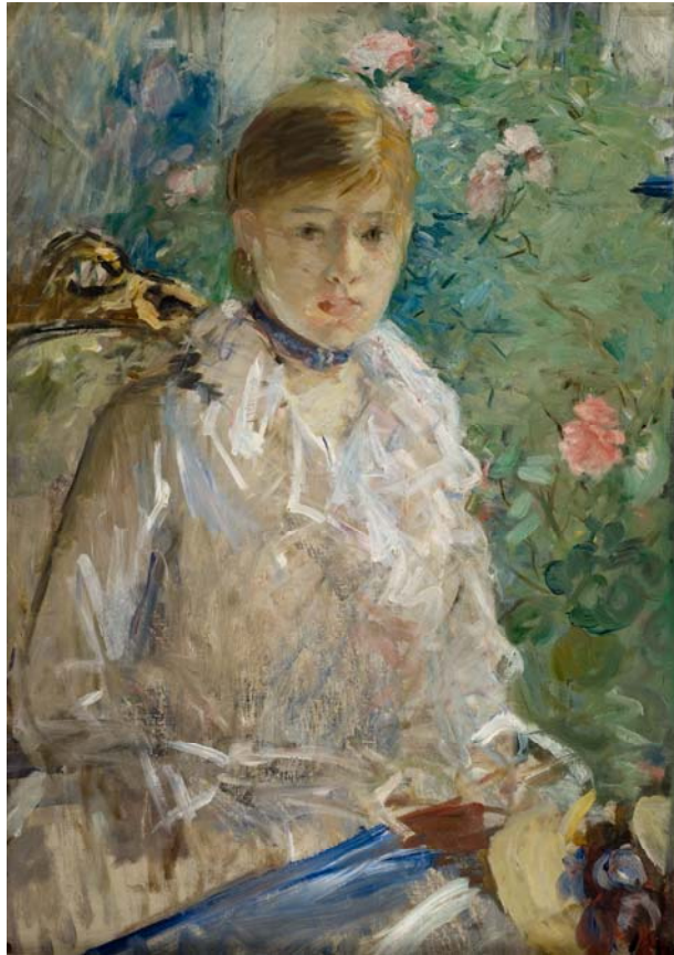
Tablèu n°3 : « L'Estiu » o « Joventa près d'una fenèstra », Berthe MORISOT, (1841-1895), retrach 1878. Musèu Fabre, Montpelhièr, Erau.