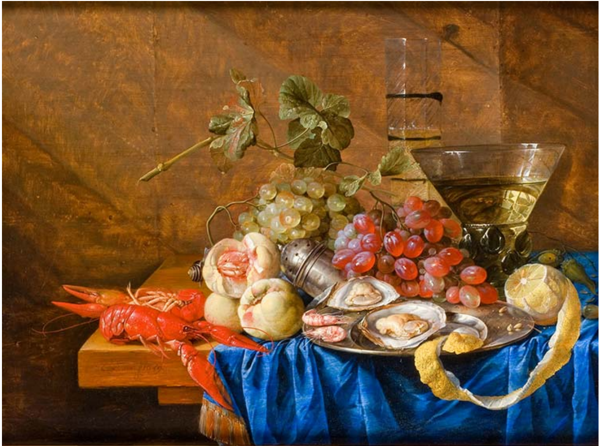
Tablèu n°4 : « Natura mòrta de fruches e de fruches de la mar », 1659, Cornelis de HEEM, (Leyde, 1631-Anvers, 1695), òli sus fusta, Musèu Fabre, Montpelhièr, Erau.

1. Tres fruches son representats sul tablèu :