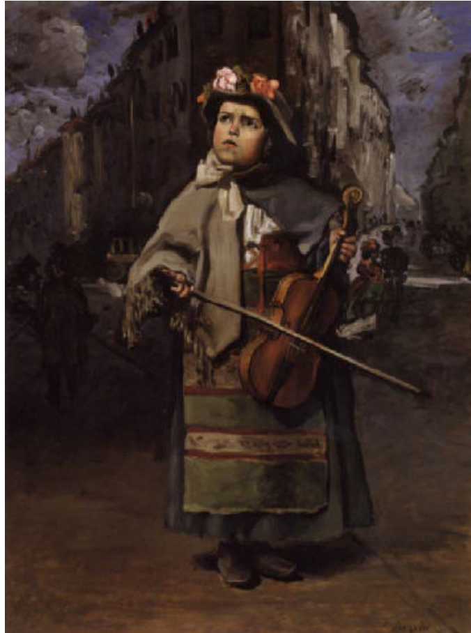
Tablèu n°2 : Frédéric BAZILLE, (Montpellier, 1841 - Beaune la Rolande, 1870), Petite Italienne chanteuse des rues , 1866, òli sus tela. Musèu Fabre - Montpelhièr Aglomeracion.