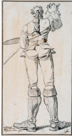
François- André VINCENT Portrait-charge du peintre Lemonnier, 1774 Pierre noire, 42,1 x 22 cm Montpellier, Musée Atger