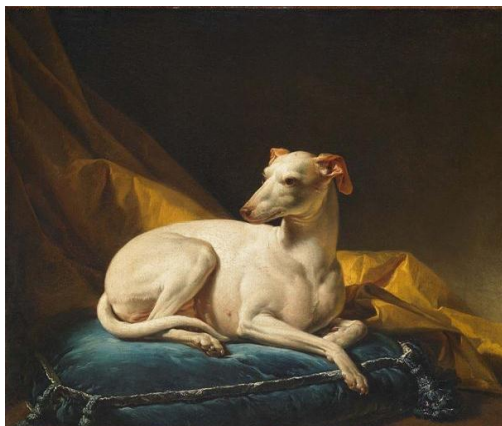
François- André VINCENT Portrait de Diane, la chienne levrette du financier de Bergeret de Grancourt, 1774 Huile sur toile 61 x 73,5 cm Besançon, Musée des Beaux-arts et d'Archéologie