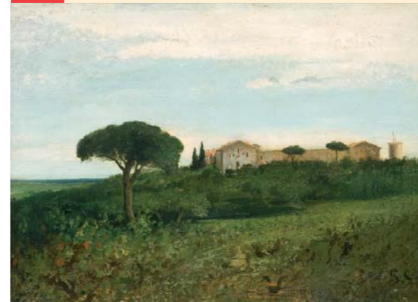
Vue de la Tour de Farges (1857), musée Fabre, Montpellier