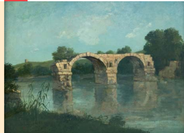
Le Pont d'Ambrussum (1857), musée Fabre, Montpellier

François Sabatier, l'hôte de Courbet à la Tour de Farges, est le commanditaire de ce tableau réalisé en 1857. Lorsque le peintre remarque les restes du vieux pont romain d'Ambrussum (1 er siècle après J.C.), la crue de 1933 n'a pas encore emporté la seconde arche. Dans ce paysage abrupt, Courbet restitue la matérialité de la pierre, semblable aux roches de ses paysages franc-comtois. Le Vidourle remplace ici la Loue, rivière chérie du peintre, dont il s'est plu à peindre le cours accidenté et tumultueux.