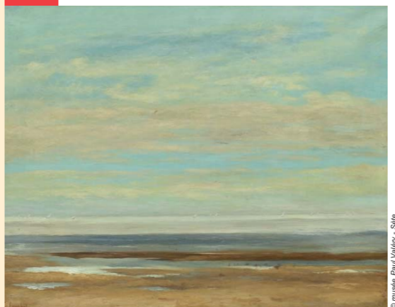
Mer calme (1857), musée Paul Valéry, Sète

Le musée Paul Valéry conserve une marine de Courbet emblématique de sa conception des « paysages de mer », tels qu'il a pu les découvrir lors de ses pérégrinations entre Sète et Villeneuve-lès-Maguelone. La composition, basée sur des variations de couleur, mêle avec génie les souvenirs de la Manche, la révélation de la lumière méditerranéenne et l'intuition de l'espace vide et des horizons infinis.