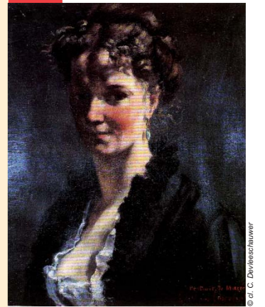
Le sculpteur Marcello (1869), musée des Beaux-Arts de Reims

« Un instant vous fûtes pour moi une des sœurs du Parnasse. Vous m'avez inspiré de la peinture et même de la sculpture », déclare Courbet à la duchesse de Castiglione, auteur de la sculpture d'Hécate et Cerbère sous le pseudonyme de Marcello. Hécate, déesse de la lune, est associée au monde des enfers dont le monstre Cerbère est le gardien. Les deux artistes sont liés par une solide amitié qui ne s'est jamais démentie, y compris pendant et après les dramatiques démêlés que connut Courbet avec le pouvoir lors de la Commune.