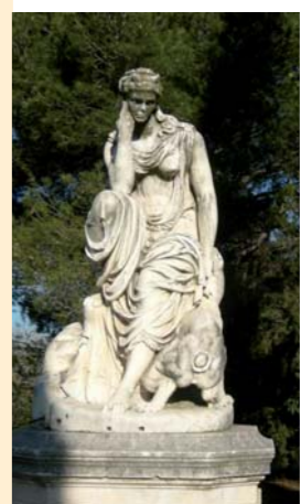
Le sculpteur Marcello, Hécate et Cerbère, Parc de Grammont

Des arts plastiques et visuels au cinéma, de la photographie au spectacle vivant, du livre à la musique ou à la danse en passant par la culture