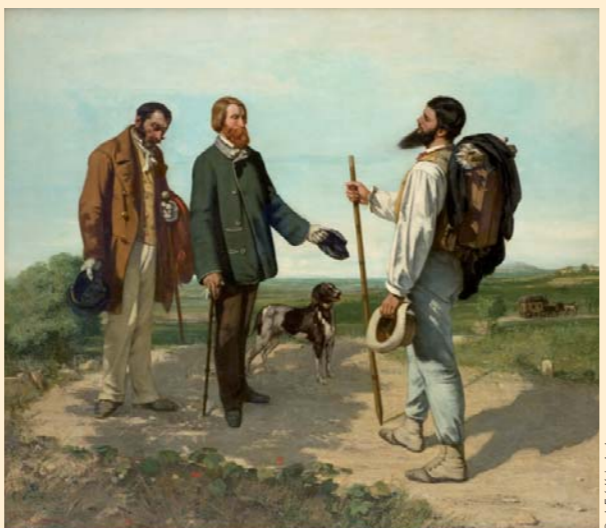
La Rencontre ou Bonjour M. Courbet (1854), musée Fabre, Montpellier

La rencontre entre Gustave Courbet et Alfred Bruyas se situe avant tout sur le terrain allégorique de l'art. Le paysage, anecdotique dans cette représentation et largement recomposé, est néanmoins caractéristique de la campagne héraultaise.