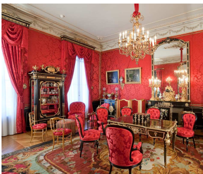
Salon Rouge, Hôtel de Cabrières Sabatier d'Espeyran

Retrouvez toutes les propositions sur www.museefabre.fr