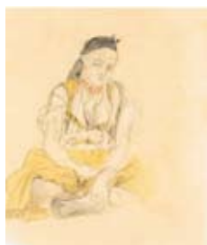
Eugène DELACROIX, Etude de femme juive, 1832 Musée Fabre, Montpellier Agglomération