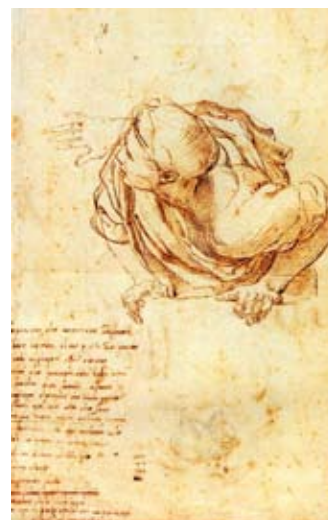
RAPHÄEL, Homme penché en avant, étude pour la Dispute du Saint Sacrement, vers 1508-1511, Musée Fabre, Montpellier Agglomération