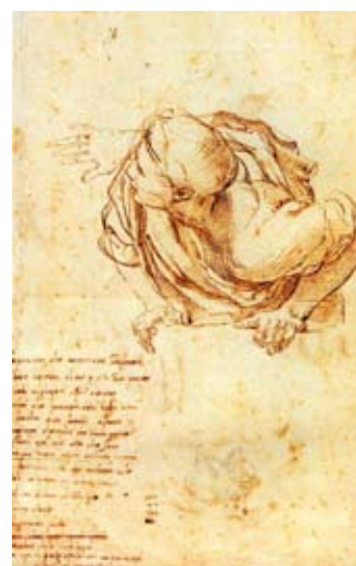
RAPHÄEL, Homme penché en avant, étude pour la Dispute du Saint Sacrement, vers 1508- 1511, Musée Fabre, Montpellier Agglomération