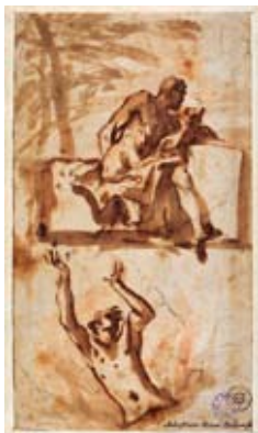
Sebastiano RICCI, Deux études d'homme Musée Sainte Croix Poitiers, Inv.882.1.135