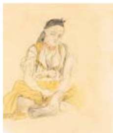
Eugène DELACROIX, Etude de femme juive, 1832 Musée Fabre, Montpellier Agglomération