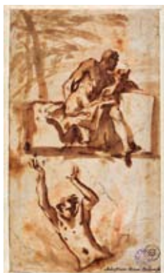
Sebastiano RICCI, Deux études d'homme Musée Sainte Croix Poitiers, Inv.882.1.135