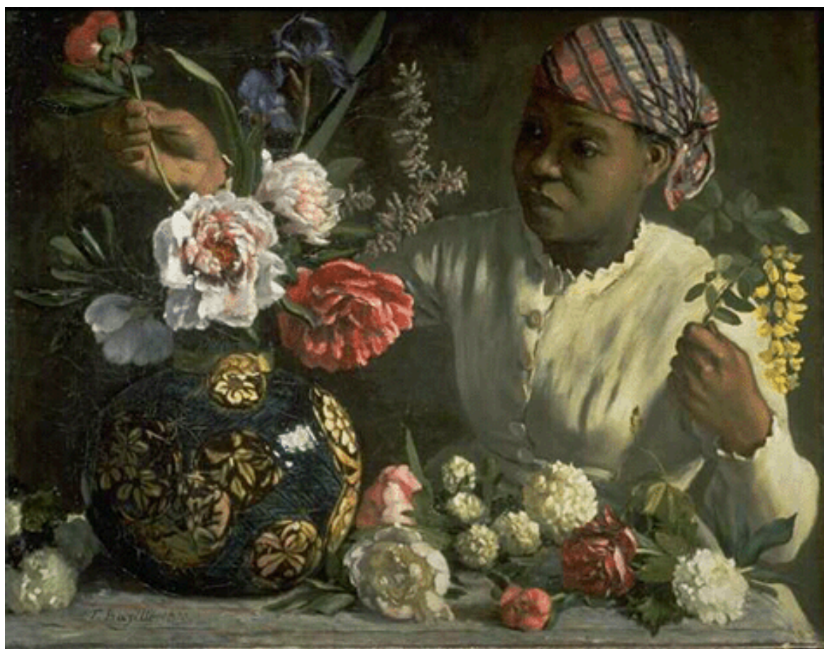
Tablèu n°5 : « La négresse aux pivoines », Frédéric BAZILLE, (Montpellier, 1841 - Beaune la Rolande, 1870), òli sus fusta, Musèu Fabre, Montpelhièr, Erau.