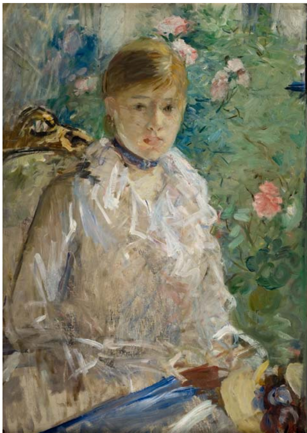
Tablèu n°3 : « L'Estiu » o « Joventa près d'una fenèstra », Berthe MORISOT, (1841-1895), retrach 1878. Musèu Fabre, Montpelhièr, Erau.